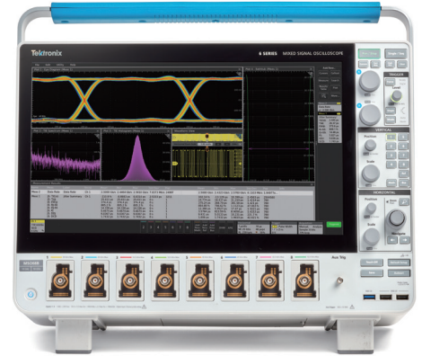
6シリーズB MSO ミックスド・シグナル・オシロスコープ