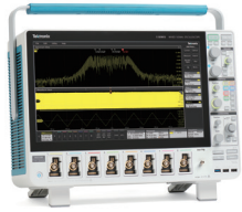
5/6シリーズB MSO ミックスド・シグナル・ オシロスコープ