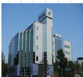
本社校正センター